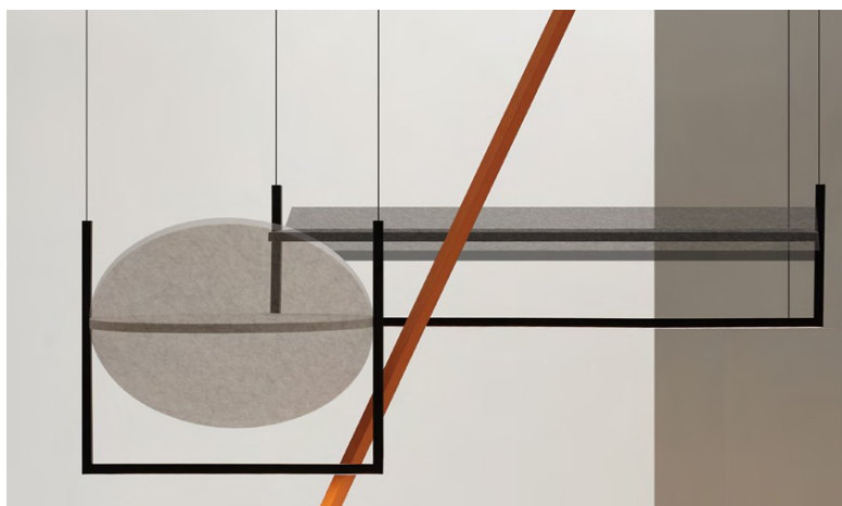
Mobile 1200 acoustic 31226-